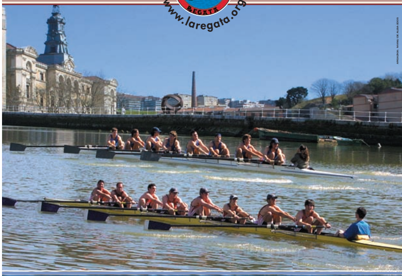
FOTOGRAFIA: JAVIER DE LA ROSA (2006)

Universidad de Deusto Deustuko Unibertsitatea